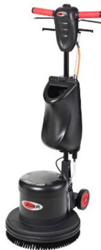
A kép illusztrációként szolgál.

A VIPER LS 160 HD alacsony sebességű egytárcsás súrolót közepes és nehéz tisztítási feladatok ellátására tervezték. A VIPER LS 160 HD egytárcsás súroló robusztus, megbízható, tartós és szervizbarát. Az ergonomikus tervezésnek köszönhetően egyszerűen súrolhatunk vagy végezhetünk permetező tisztítást keménypadló felületeinken.